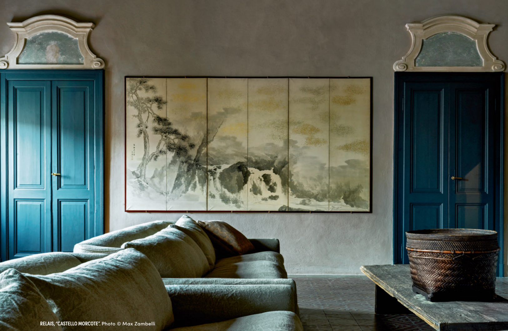
RELAIS, "CASTELLO MORCOTE".