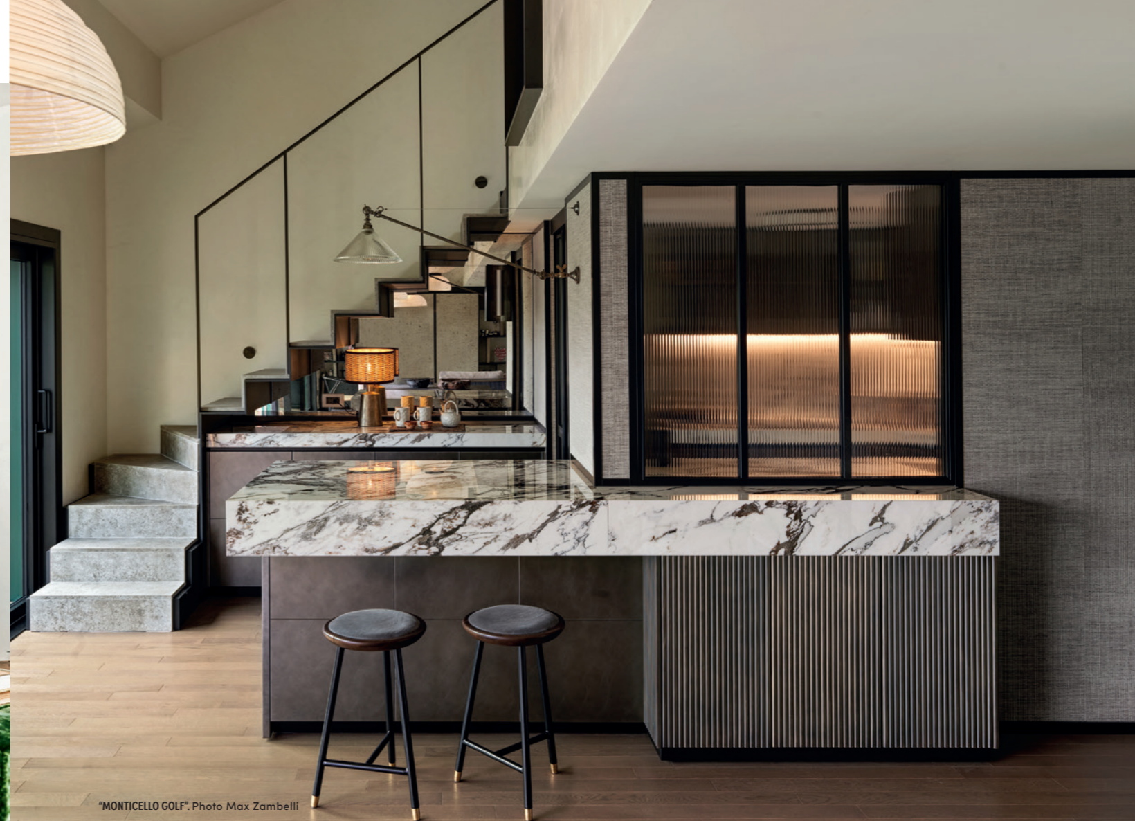
"MONTICELLO GOLF".

Pode contar-nos um pouco mais do dia-a-dia vivido no estúdio FNA? Nós somos um estúdio-boutique; a minha equipa é a minha família do dia-a-dia. O meu arquitecto sénior é mais FNA do que eu mesma. No fundo, quero que cada pessoa da minha equipa adore aquilo que faz. Somos muito nómadas, e tendo projectos por todo o mundo, criamos equipas em cada lugar. Isto é um desafio, mas, ao mesmo tempo, encaramos sempre como uma oportunidade para aprender e criar com novas formas de pensar.