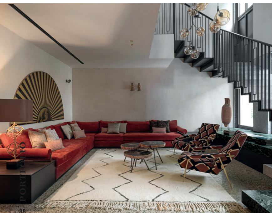
RESIDÊNCIA PRIVADA MILÃO/PRIVATE RESIDENCE MILAN.