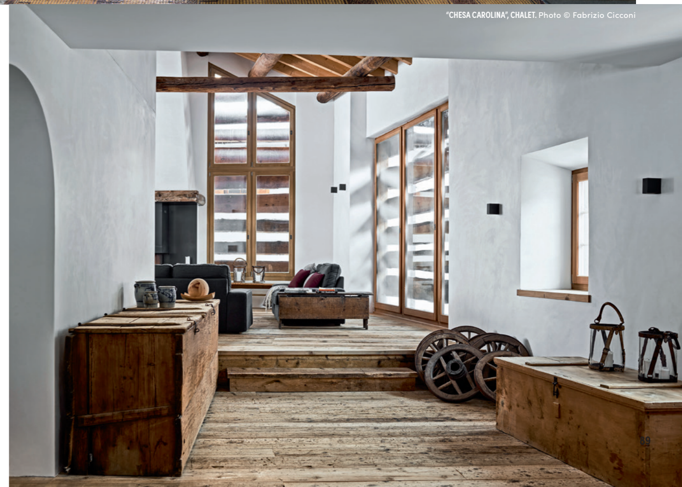
“CHESA CAROLINA”, CHALET.