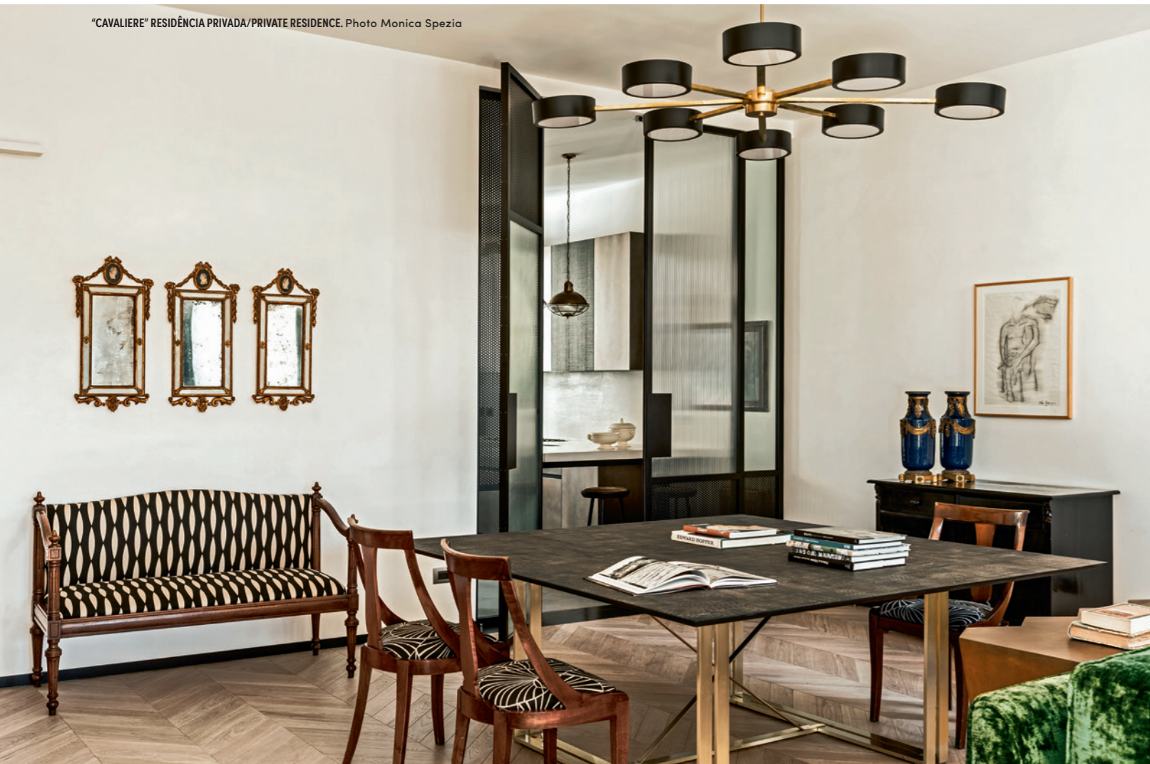
"CAVALIERE" RESIDÊNCIA PRIVADA/PRIVATE RESIDENCE.